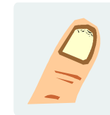
Brüchige Nägel mit Abschuppung

Die Veränderungen der Nägel werden oft durch Erkrankungen hervorgerufen. Dazu gehören z.B. die Schuppenflechte (Psoriasis), die Zuckerkrankheit (Diabetes) oder Pilzinfektionen (Onychomykose). Letztere sind der Auslöser für mehr als 50% der Nagelveränderungen.